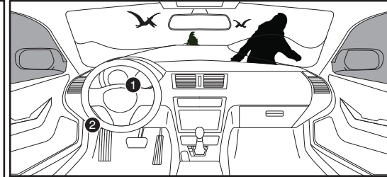
Steering Lock Connector